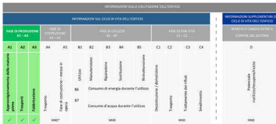
Figura 3: Moduli informativi indagati in accordo con la UNI EN 15804

In accordo con la norma di riferimento UNI EN 15804 e la PCR seguita, la valutazione di impatto ambientale di ciclo di vita dei è del tipo Cradle-to-Gate (Figura 3). L'analisi si è caratterizzata secondo una suddivisione in moduli informativi che includono: A1 - raw material supply, A2 – Transport e A3 - manufacturing. Sono state escluse i successivi moduli, poiché il prodotto va incontro a utilizzi i quali influiscono anche sullo scenario di fine vita del prodotto.